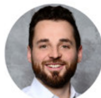
Simon MA-Entwicklung / Diversity