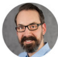
Jan Führung / Kommunikation