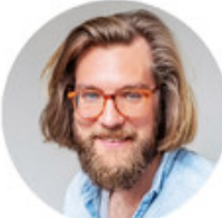
Marco Teamentwicklung / Selbstorganisation