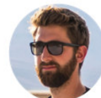
Rouven Corporate Movies / Social media

Storylines Organisationsentwicklung GmbH kontakt@storylines.hamburg | www.storylines.hamburg | +49 157-71496362 Adresse: Am Turnierplatz 13 - 21266 Jesteburg