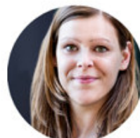
Verena Agile HR / Modernes Recruitment